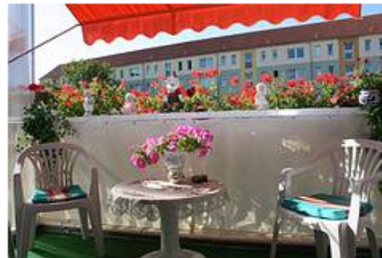
Die Neubrandenburger Wohnungsgesellschaft (Neuwoges) gehört zu den größten Wohnungsunternehmen in Mecklenburg Vorpommern. Sie verwaltet ungefähr 12.000 eigene Mietwohnungen und etwas über 2.000 Wohnungen im WEG-Bereich.

Die Rauchmelder, die KALORIMETA installiert, entsprechen der DIN 14604, laufen mit einer Zehn-Jahres-Batterie und werden sicher an der Zimmerdecke verschraubt. Weiterer KALORIMETA-Vorteil: die Rauchmelder werden fortan zum selben Termin gewartet, an dem auch die Heizkostenverteiler und die Wasserzähler in den Neuwoges-Wohnungen abgelesen werden. Ein doppelter Service also – zum doppelten Preis? "Nein", sagt Gesswein entschieden. "Schließlich pflegt KALORIMETA die Stammdaten unserer Liegenschaften schon seit Jahren. Aber der Preis einer Dienstleistung sagt überhaupt nichts über ihre Qualität. Daher ist es mir fast wichtiger zu erwähnen, dass KALORIMETA jeden Vor-Ort-Termin mit einer Ablesequittung abschließt, auf der die Heizkostenverteiler und die Wasserzählerverbrauchswerte notiert werden. Auf dieser